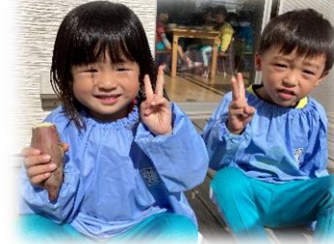
ホクホクのおいもはあまくておいしかったね～！